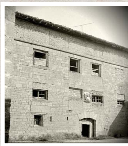
Casa Aragontxo. Años 70.

En fin. Después de tres años de espera - pasado lo peor de la pandemia, agradeciendo a los que nos han ayudado a superarla - con o sin zurrapote , deseamos que estas fiestas sean una explosión de alegría, prudencia y sana armonía.