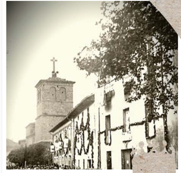
1945. Casa Izaguirre, Casa Matxinea, Casa EL veterinario.

En años posteriores varias cuadrillas o peñas más fueron habilitando bajeras para reunirse ocasionalmente para las fiestas. Durante algún tiempo se les siguió denominando zurrapote a estos locales, que en otros lugares se les llama chamizos, piperos, pipotes .... Era común decir: